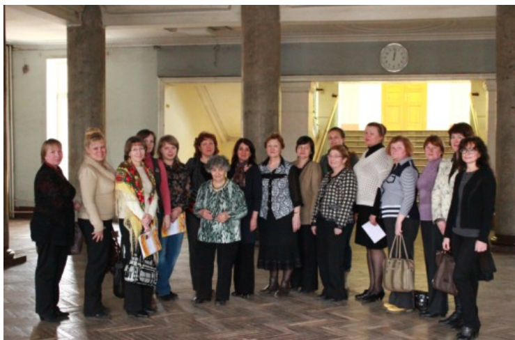
Иллюстрация 2: Учителя участников заключительного тура 2014 года во время Олимпиады

К участию в Олимпиаде приглашаются все желающие. Школьные организаторы конкурсов КИО и Бобёр, которые регулярно общаются с Оргкомитетом олимпиады через сайты олимпиады ( http://dmti.ipospb.ru ) и сайты конкурсов ( http://bebras.ru/ , http://kio.spb.ru/kio ) (за года проведения конкурса число учителей, участвующих в проектах, связанных с конкурсами превысило 3000) активно поддерживают проведение олимпиады, поэтому география участников олимпиады большая.