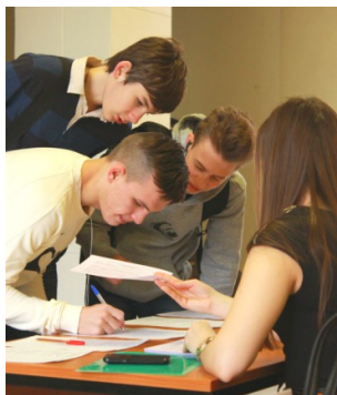
Иллюстрация 1: Регистрация участников

В 2013-2014 году Олимпиада была проведена впервые, а в 2014-2015 году прошла во второй раз.